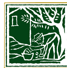
CASA OLEARIA TAGGIASCA