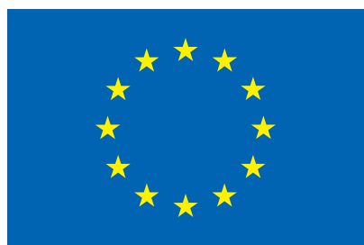
UNIONE EUROPEA Fondo Europeo di Sviluppo Regionale